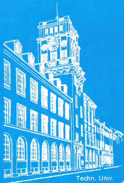
Techn. Univ. München

in Verbindung mit der 3rd Conference of the European Co-Operation in Informatics