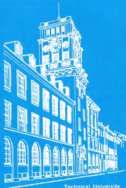
Technical University Munich

IN CONJUNCTION WITH THE ELEVENTH ANNUAL CONFERENCE OF THE GESELLSCHAFT FÜR INFORMATIK