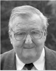
Carl Adam Petri