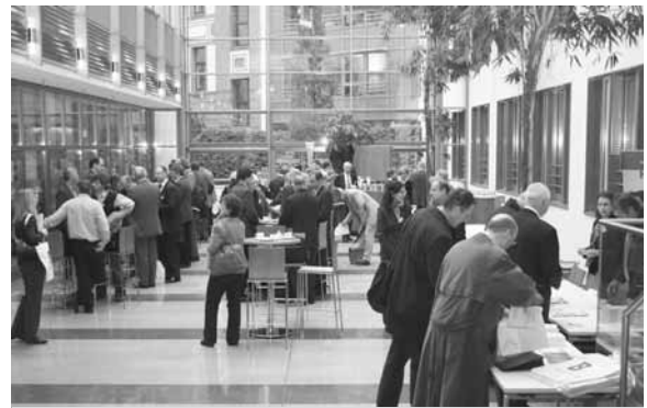
GI-HRK-Symposium in Berlin

Neue Lehre in der Informatik? Mit dieser und anderen Fragen rund um nationale und internationale Qualitätsrahmen beschäftigten sich am 22. Oktober 2009 in Berlin rund 100 Fachleute aus Politik, Wirtschaft und Wissenschaft auf Einladung von GI und Hochschulrektorenkonferenz. Neben den Auswirkungen des Bologna-Prozesses diskutierten die Fachleute über Transparenz und Vielfalt in der Lehre, die angestrebte Vergleichbarkeit von Hochschulabschlüssen in Europa, Möglichkeiten zur Verringerung der Abbruchquoten im Studium der Informatik und die Zukunft des Faches als Voll- und Teilzeitstudium. Die Ergebnisse des Symposiums waren Grundlage für die Arbeit einer Arbeitsgruppe beim zwei Monate später stattfindenden IT-Gipfel. | WWW.HRK.DE/BOLOGNA/DE/HOME/1945_4022.PHP