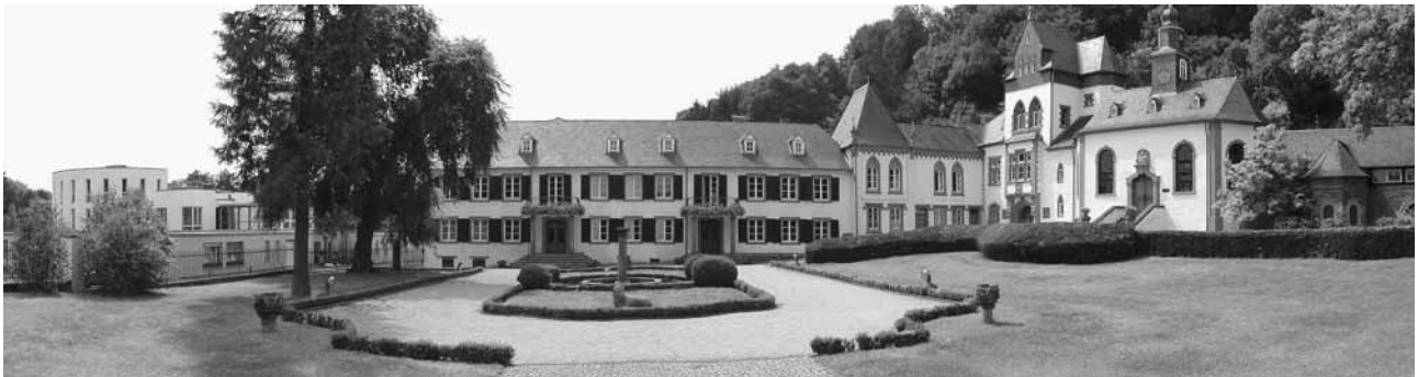
Schloss Dagstuhl – Leibniz-Zentrum für Informatik, Quelle: Schloss Dagstuhl

WWW.GI.DE/SERVICE/PUBLIKATIONEN/LNI.HTML · WWW.IO-PORT.NET/