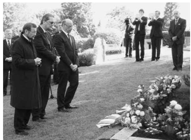
Kranzniederlegung am Grab von Konrad Zuse am 22. Juni 2010 in Hünfeld

WWW.HORST-ZUSE.HOMEPAGE.T-ONLINE.DE/ HORST-ZUSE-ZUSE-JAHR-2010-HTML/ Z-2010/HUENFELD.HTML